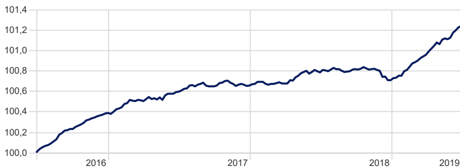
Kainos pokytis grafike nuo 2016.06.30 iki 2019.06.30