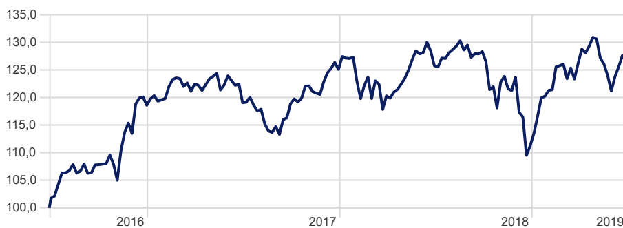
Kainos pokytis grafike nuo 2016.06.30 iki 2019.06.30