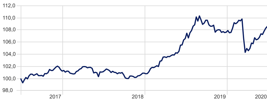
Kainos pokytis grafike nuo 2017.06.30 iki 2020.06.30