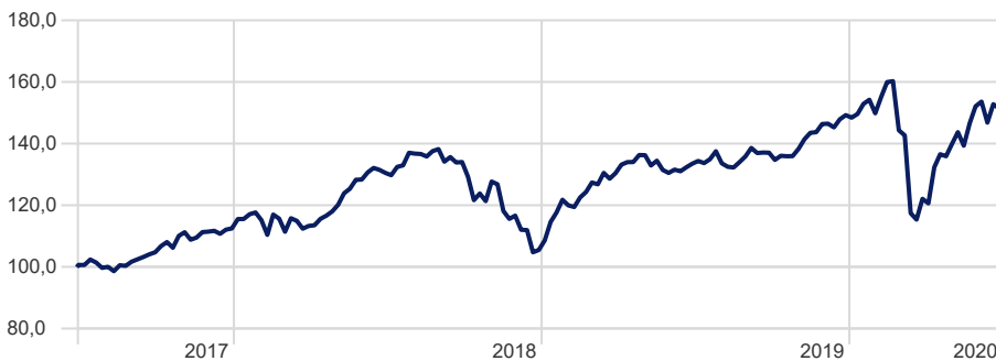
Kainos pokytis grafike nuo 2017.06.30 iki 2020.06.30